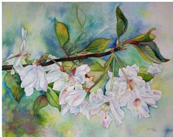
Kirschblütenfest © Aquarell auf Leinwand von Frank Koebsch

Für die Kennenlernrunde, die Einweisung in die Aquarellmalerei und als Schlechtwettervariante stehen Räumlichkeiten im Kornspeicher zur Verfügung. Diese Malreise ist eine einzigartige Gelegenheit, Ihre Liebe zur Kunst mit den Entdeckungen in der Natur zu verbinden. Erleben Sie die Magie des Malens in einem idyllischen Gartenparadies und nehmen Sie am Ende Ihrer Reise nicht nur wundervolle Aquarelle, sondern auch unvergessliche Erinnerungen mit nach Hause.