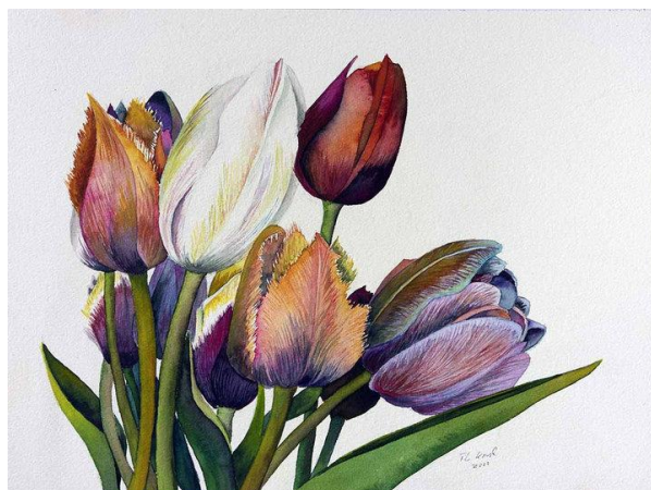
Einfach nur schön © Tulpen Aquarell von Frank Koebsch