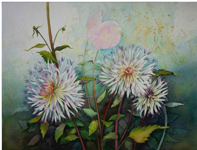
Dahlienblüten – Farbtupfer im Herbst © Aquarell von Frank Koebsch

Frank.Koebsch@gmail.com https://www.atelier-koebsch.de/