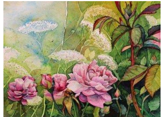
Rosengarten © Aquarell von Frank Koebsch