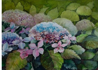
Farbspiel der Hortensien © Aquarell von Frank Koebsch