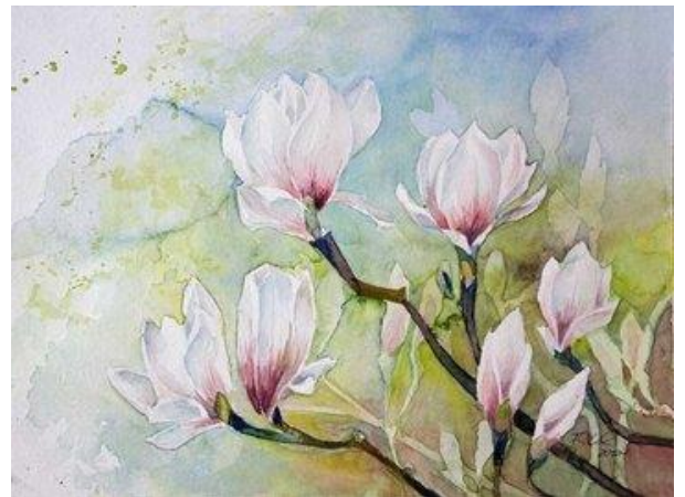
Magnolienblüten als Frühlingsboten © Aquarell von Frank Koebsch