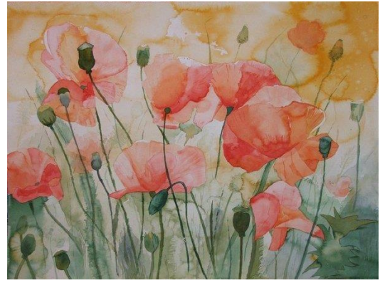
Traum im Mohnfeld © Aquarell von Frank Koebsch

Verbringen Sie gemeinsam mit anderen Malschülern und Ihrem Dozenten Frank Koebsch vier Tage in einem landschaftlichen Kleinod, fernab allen Trubels. Tauchen Sie ein in die zauberhafte Welt der Farben bei einer exklusiven Malreise mit Fokus auf Aquarellen von Blumen, Blüten, Stauden und Bäumen. Verbringen Sie eine inspirierende Zeit inmitten der malerischen Kulisse eines idyllischen Parks dessen Herzstück das bezaubernde Gutshaus ist.