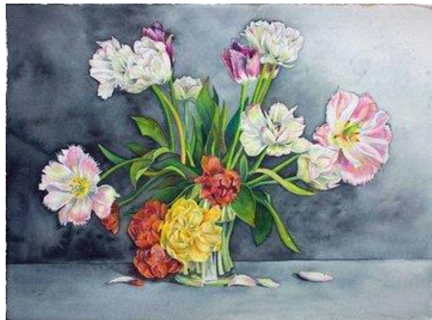
Ein wunderschöner Tulpenstrauß © Aquarell von Frank Koebsch