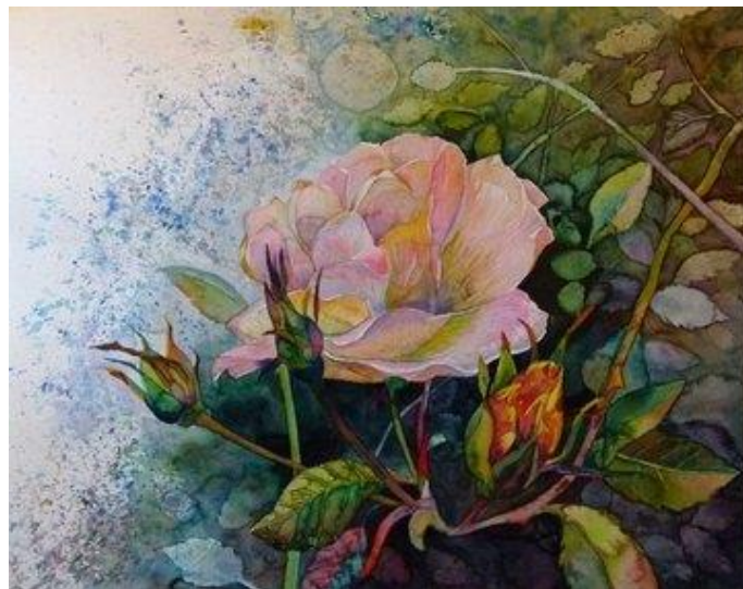
Blüten in der Herbstsonne © Rosen Aquarell von Frank Koebsch