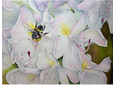
Eine Hummel nascht in den Rhododendronblüten © Aquarell von Frank Koebsch