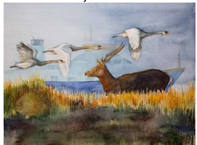
Rendezvous an der Ostsee