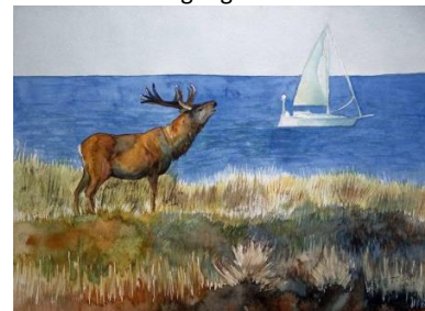
Rothirsch – Wahrzeichen der Ostseeküste auf dem Darß