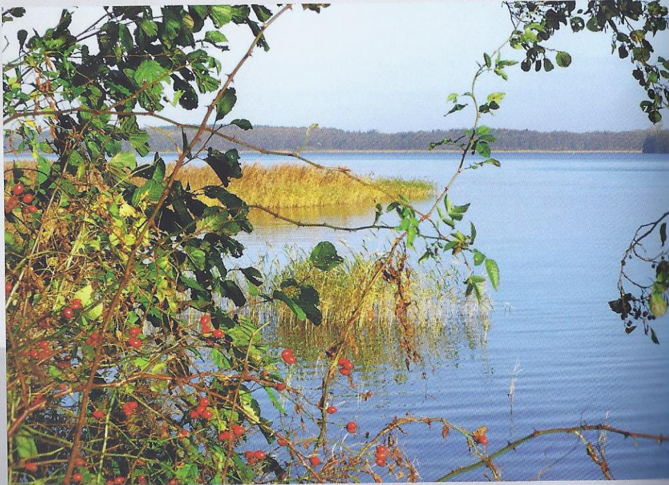
Sommer am Schaalsee.